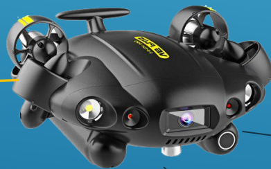
FIFISH V6 PLUS